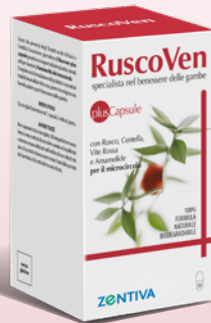
50 CAPSULE Integratore alimentare

Si consigliano 4 nebulizzazioni per applicazione, anche ripetute nell'arco della giornata.