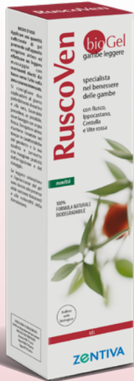
Biogel 100 ml Cosmetico