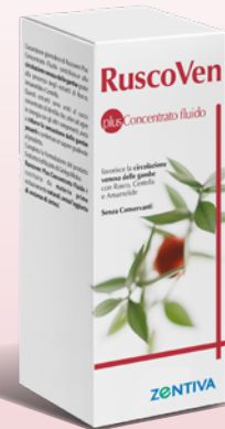
Concentrato fluido 200 ml Integratore alimentare

Si consigliano 2 nebulizzazioni per applicazione nei bambini e 4 negli adulti.